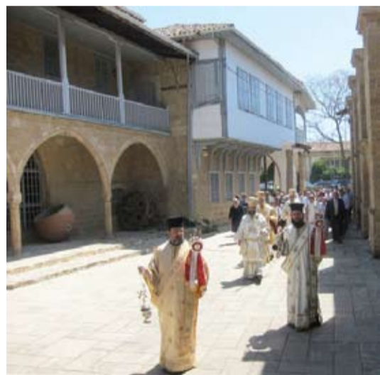
Λιτανεία στον Εσπερινό της Αγάπης στον Καθεδρικό Ναό Αγίου Ιωάννου του Θεολόγου

Το Βυζαντινό Μουσείο βρίσκεται στην αυλή του Καθεδρικού Ναού του Αγίου Ιωάννου του Θεολόγου και θεωρείται ως το πιο σημαντικό μουσείο εκκλησιαστικής τέχνης. Σ' αυτό φυλάσσονται πολύ σημαντικές εικόνες από τον 8ο αιώνα μέχρι και το 19ο αιώνα με αποτοιχισμένες τοιχογραφίες και τα τμήματα από το ψηφιδωτό της εκκλησίας της Παναγίας Κανακαρίας του 8ου αιώνα μ.Χ. και τοιχογραφίες της εκκλησίας του Αγίου Ευφημιανού στη Λύση που αποτοιχίστηκαν από Τούρκους αρχαιοκάπηλους μετά το 1974 και επαναπατρίστηκαν.