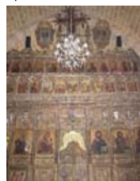
Εσωτερικό του Ναού Αγίου Αντωνίου

Καθημερινά: Δευτ.-Σάβ.: 7:00-11:00 / Απρ.-Αύγ.: 16:00-18:30 / Σεπτ.-Μάρτ.: 15:00-16:30 Τηλέφωνο: 22432838