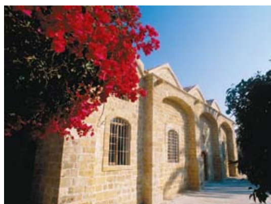
Ναός Αγίου Κασσιανού

Ο Ναός του Αγίου Κασσιανού βρίσκεται κοντά στο Ναό της Χρυσαιλιωτίσσας και στη σημερινή του μορφή είναι δίκλιτος. Ο Ναός είναι κτίσμα του 1854, σύμφωνα με επιγραφή, και οικοδομήθηκε πάνω σε αρχαιότερο Ναό. Από την εκκλησία του Αγίου Κασσιανού προέρχονται πολλές και σημαντικές εικόνες που σήμερα φυλάσσονται στο Βυζαντινό Μουσείο, στη Λευκωσία.