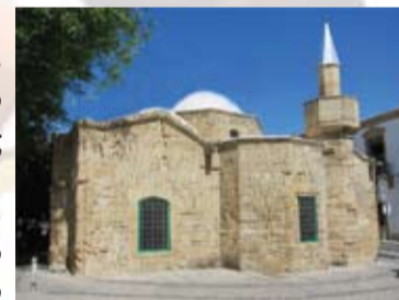
Ναός Τιμίου Σταυρού του Μισιρικού

Ο Τίμιος Σταυρός του Μισιρικού βρίσκεται στα ανατολικά της εκκλησίας της Φανερωμένης. Είναι μία μικρόν διαστάσεων εκκλησία που χρονολογείται στα χρόνια της Ενετοκρατίας, δηλαδή στο πρώτο μισό του 16ου αιώνα. Στα χρόνια της τουρκοκρατίας μετατράπηκε σε μουσουλμανικό τέμενος με την ονομασία Αραπλάρ, δηλαδή των Αράβων. Ο Ναός είναι τρίκλιτος με τρούλο, αλλά δεν διασώζονται σ' αυτό τοιχογραφίες.