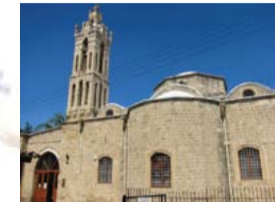
Ναός Αρχαγγέλου Μιχαήλ του Τρουπιώτη (ανατολική είσοδος)

Απρίλιο-Οκτώβριο: 07:00-12:00 και 17:00-18:30 / Νοέμβριο-Μάρτιο: 07:00-12:00 και 16:00-18:00 (Τετάρτη και Κυριακή απόγευμα κλειστά), Τηλέφωνο: 22663601