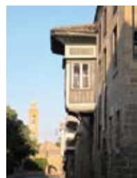
Ναός Αγίου Αντωνίου