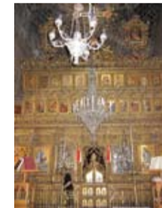
Εσωτερικό του Ναού Αρχαγγέλου Μιχαήλ του Τρουπιώτη