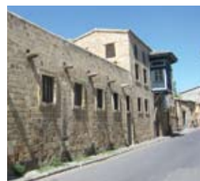
Αρχοντικό Δραγουμάνου Χατζηγεωργάκη Κορνέσιου