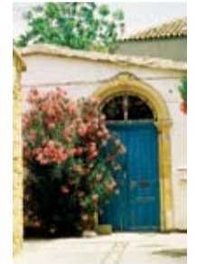
Πόρτα στην παλιά πόλη της Λευκωσίας