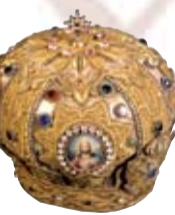
Αρχιερατική Μίτρα Αρχιεπισκόπου Μακαρίου Γ' (1950-1977)