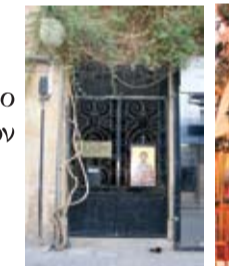
Ναός Αγίου Ελευθερίου, Μετόχιον Ι. Μ. Μαχαριά

Ωράριο: 08:00-12:00 και 16:00-18:00 Τηλέφωνο: 22664737