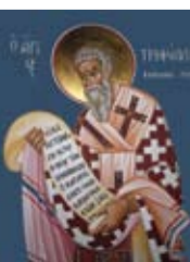
Ο Άγιος Τριφύλλος Ληθρών (Λευκωσίας) Παρεκκλήσιο Απ. Βαρνάβα, Αρχιεπισκοπικό Μέγαρο