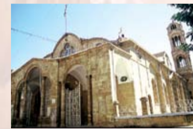
Ναός Παναγίας Φανερωμένης

Δευτέρα-Σάββατο: 06:30-13:00, Απρίλιο-Οκτώβριο: 16:00-20:00 / Νοέμβριο-Μάρτιο: 15:00-18:30 και Κυριακή: 06:00-12:00 (απόγευμα Κυριακής ανοικτά, μόνο όταν υπάρχει ακολουθία) Τηλέφωνα: 22673296, 22660761