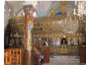
Εσωτερικό του Ναού Αγίου Σάββα

Καθημερινά: 06:00-12:00 και 15:30-18:00 (Τετάρτη και Κυριακή απόγευμα κλειστά), Τηλέφωνο: 22755120