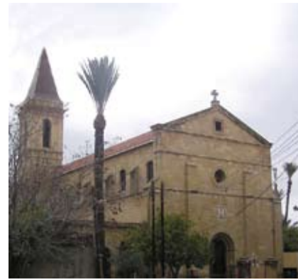
Εκκλησία Τιμίου Σταυρού, των Ρωμαιοκαθολικών

Εκδοτική και καλλιτεχνική επιμέλεια: ΜΕΘΕΞΙΣ διακονία πολιτισμού Σχεδιασμός-επεξεργασία: Χαράλαμπος Χαράλαμπίδης Χαρακτικά μοτίβα: Γιώργος Τσαργάρης Λογότυπο: δια χειρός Πατρός Δημοσθένη Δημοσθένους Κείμενα: Γιώργος Φιλοθέου, Αρχαιολόγος Φωτογραφίες Εξωφύλλου: Κυπριακός Οργανισμός Τουρισμού Χάρτες: Τμήμα Κτηματολογίου και Χωρομετρίας Κύπρου Πηγή: έκδοση «Κύπρος, Νήσος Αγίων-Θρησκευτική Περιήγησης» του Κυπριακού Οργανισμού Τουρισμού 2008.