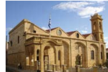
Ναός Αγίου Σάββα

Ο Ναός του Αγίου Σάββα είναι παλαιά εκκλησία, η οποία δέχθηκε ανακαινίσεις και επεκτάσεις μέσα στους αιώνες. Σύμφωνα με παλαιότερες μαρτυρίες ο ναός ανακαινίστηκε το 1781 και παλαιότερα το 1608, όπως αναφέρεται σε επιγραφή. Σύμφωνα με εντοιχισμένη πλάκα στη νότια πλευρά του ναού φαίνεται ότι ο σημερινός ναός οικοδομήθηκε το 1851. Το ξυλόγλυπτο εικονοστάσιο κατασκευάστηκε το 1801. Το 1870 έγινε επέκταση του εικονοστασίου, ώστε δημιουργήθηκε και δεύτερο Ιερό Βήμα, όπως είναι ο ναός του Αγίου Κασσιανού. Η εκκλησία του Αγίου Σάββα έχει δύο πολύτιμα κειμήλια: το Σταυρό του παλαιού εικονοστασίου, του 1659, έργο του Παύλου ιερογράφου και το χρυσό Άγιο Ποτήριο, που χρονολογείται στα 1596.