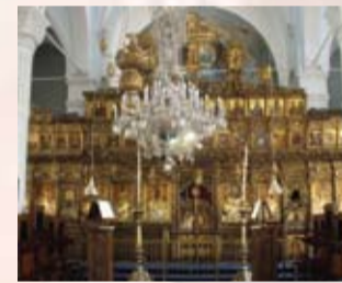
Εσωτερικό του Ναού Παναγίας Φανερωμένης