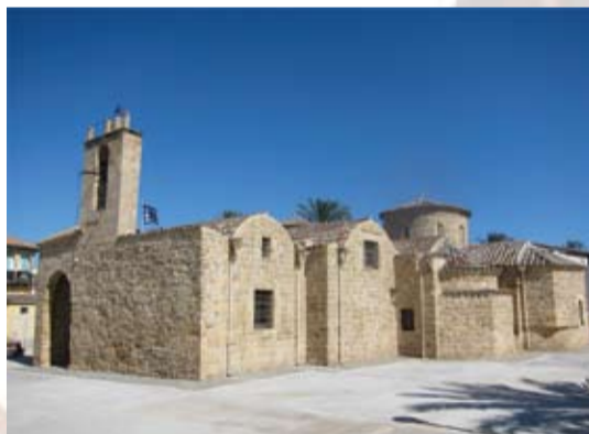
Ναός Παναγίας Χρυσαιλιωτίσσας (ανατολική πλευρά)

Είναι η πιο σημαντική βυζαντινή εκκλησία της Λευκωσίας και η μοναδική εκκλησία της μεσαιωνικής πόλης που μπορεί να χρονολογηθεί από τη μέση βυζαντινή περίοδο. Η αρχική εκκλησία κτίστηκε ως ένας σταυροειδής εγγεγραμμένος με τρούλο ναός, αλλά στα μεταγενέστερα χρόνια δέχθηκε τόσες πολλές προσθήκες, που αλλοίωσαν σε μεγάλο βαθμό την αρχική του μορφή. Από την Εκκλησία της Χρυσαιλιωτίσσας προέρχεται ένας πολύ μεγάλος αριθμός σημαντικών εικόνων που εκτίθενται στο Βυζαντινό Μουσείο, στη Λευκωσία.